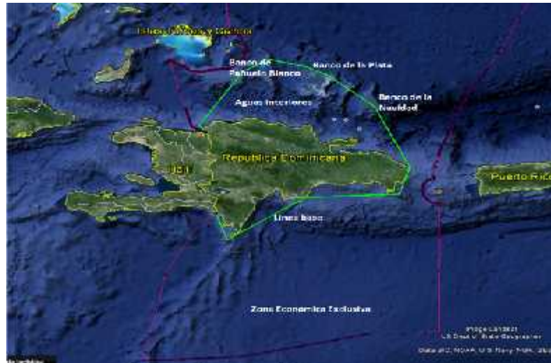
Imagen No.12 Limites según Ley 66-07 Estado Archipelágico