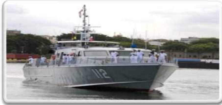
Imagen No.7 GC-112, Altair