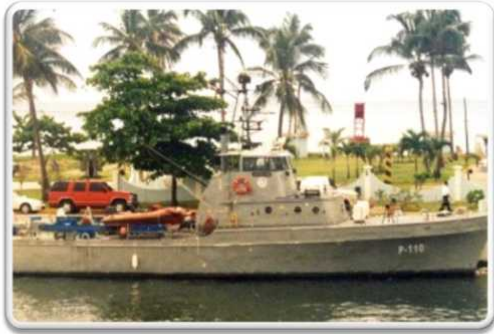
Imagen No.9 GC-110, Cirius