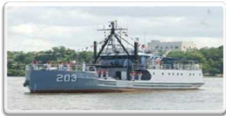
Imagen No.5 PM-203, Tortuguero