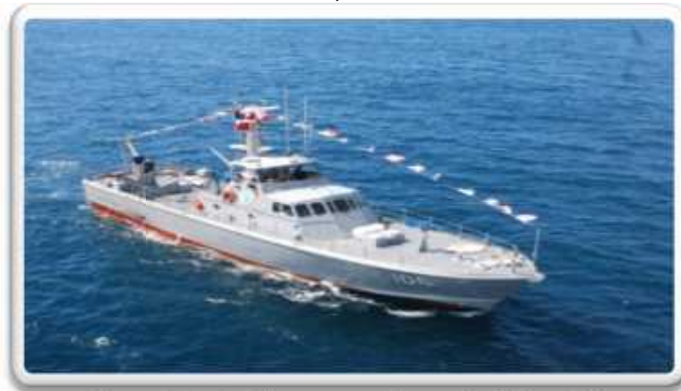
Imagen No.4 GC-106, Bellatrix

El patrullero de altura Almirante Didiez PA-301 (ex-USCGC BUTTONWOOD), fue adquirido por el Estado Dominicano el 28 de junio del 2001, durante una ceremonia celebrada en la ciudad de San Francisco, California, lugar que sirvió como puerto hogar del entonces buque de auxilio de las ayudas a la navegación.