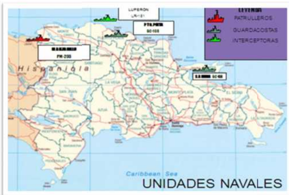
Imagen No. 13 Despliegue Unidades Superficie Comando Naval Norte